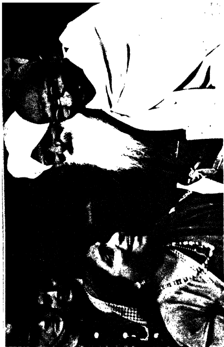
बापू और उनकी 'अम्माजान': प्रसन्न मुद्रा में (गोलमेज परिवर्ष के समय का चित्र)